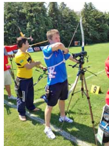
Česká výprava v Antalyi