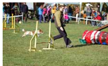
Foto 1 - Pražský krysařík Marwin Foto 2 - Denisa Vaněčková a Dobby