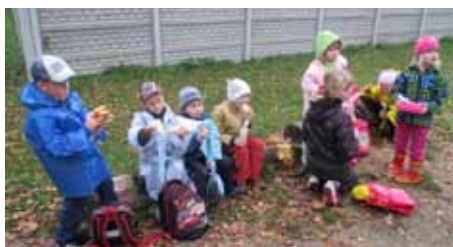
Děti a učitelky z MŠ u Pivovaru

Výlet se nám vydařil i přesto, že jsme trochu zmokli, ale už se těšíme na další.