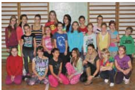
ZK street show dance

V letošním roce se nově otevřel ZK volejbalu pro 2. až 4. ročník a experti pro žáky pátého ročníku. Rozrostla se fotbalová základna (dorost, žáci, příprava mladší i starší a ti nejmenší Elev). Největší zájem je o karate, kopanou, airsoft, florbal, basketbal, mažoretky, vybijenou a street show dance.