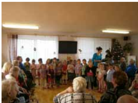
Děti a zaměstnanci MŠ Zahradní

Děkujeme za pozvání zaměstnancům Domova pro seniory v Dolních Pochlovicích.