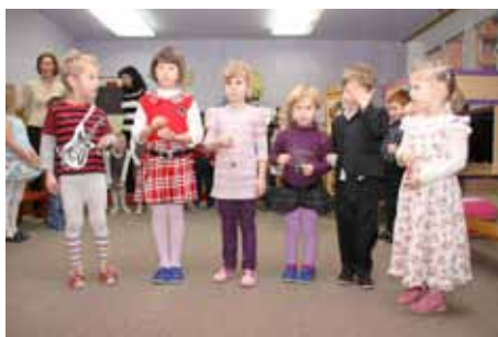
Učitelky a děti z MŠ U Pivovaru