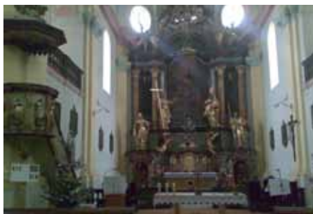
dokončený hlavní oltář 2013

do tří samostatných etap. První etapa, ve které byla restaurována oltářní architektura nad hlavní římsou včetně hlavní římsy, sochařská a řezbářská výzdoba v části nad hlavní římsou včetně prvků nad oltářním obrazem a plastiky andělů z dolní části oltáře, byla zahájena v roce 2011. Na provedení této etapy přispělo Ministerstvo kultury ČR částkou 256.000 Kč, finanční podíl města činil 268.700 Kč. V roce 2012 byly ve II. etapě restaurování hlavního oltáře provedeny práce v prostoru mezi hlavní římsou a spodní římsou (mimo již zrestaurovaného oltářního obrazu). Ministerstvo kultury ČR přispělo 206.000 Kč, finanční podíl města činil 291.040 Kč. Restaurátorské práce hlavního oltáře byly dokončeny III. etapou realizovanou v roce 2013. Závěrečná etapa zahrnovala restaurování v prostoru pod spodní římsou,