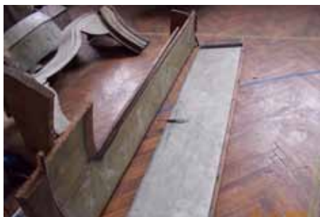
rozebraný oltář v depozitu

mie, provede revizi a doplnění zlatení (plátkovým zlatem) a stříbření částí oltářů, barevnou retuš a rekonstrukci polychromie a závěrečnou povrchovou úpravu. Před vlastní montáží oltářů zpět do kostela musí být provedeno statické zpevnění konstrukcí oltářů, aby v budoucnu nedošlo k jejich poškození. Od roku 2007 město Kynšperk nad Ohří, majitel kostela Nanebevzetí Panny Marie a oltářní architektury, pro možnost finančního zajištění restaurátorských prací každoročně podávalo žádosti o příspěvek na Ministerstvo kultury ČR z Programu podpory obnovy movitých kulturních památek a na Ministerstvo kultury ČR přes obce s rozšířenou působností. Obnova hlavního oltáře (původem z roku 1765) byla s ohledem na velikost oltáře a rozsah nutných restaurátorských prací rozdělena