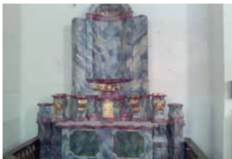
dokončená I. etapa bočního oltáře

mie, provede revizi a doplnění zlatení (plátkovým zlatem) a stříbření částí oltářů, barevnou retuš a rekonstrukci polychromie a závěrečnou povrchovou úpravu. Před vlastní montáží oltářů zpět do kostela musí být provedeno statické zpevnění konstrukcí oltářů, aby v budoucnu nedošlo k jejich poškození. Od roku 2007 město Kynšperk nad Ohří, majitel kostela Nanebevzetí Panny Marie a oltářní architektury, pro možnost finančního zajištění restaurátorských prací každoročně podávalo žádosti o příspěvek na Ministerstvo kultury ČR z Programu podpory obnovy movitých kulturních památek a na Ministerstvo kultury ČR přes obce s rozšířenou působností. Obnova hlavního oltáře (původem z roku 1765) byla s ohledem na velikost oltáře a rozsah nutných restaurátorských prací rozdělena