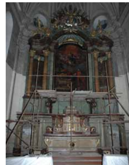
práce na II.etapě hlavního oltáře

Oltáře jsou evidovány v Ústředním seznamu kulturních památek České republiky, restaurátorské práce musí provádět pouze restaurátoři, kteří jsou držiteli příslušného povolení Ministerstva kultury ČR k restaurování. Všechny práce prováděné při restaurování musí být odsouhlaseny orgánem státní památkové péče a zástupci NPÚ Locket nad Ohří. Dokončení prací musí být doloženo podrobnou restaurátorskou zprávou a zápisem z přejímky dokončeného díla potvrzeným NPÚ. Před zahájením restaurování provede restaurátor fotodokumentaci současného stavu památky. Následně restaurátor odstraní povrchové nečistoty, sejme nepůvodní polychromii, sejme případné přemalby, upevní barevné vrstvy polychromie, petrifikuje jednotlivé části oltářů, provede dořezby a modelaci chybějících částí, zacelí praskliny, zatmelí poškozená místa polychro-