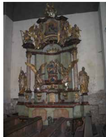
boční oltář před demontáží v roce 2005

Před rekonstrukcí kostela Nanebevzetí Panny Marie v Kynšperku nad Ohří byla v roce 2005 kompletně demontována oltářní architektura kostela. Při rozebírání se zjistilo, že oltáře jsou v havarijním stavu, napadené dřevokaznými škůdci. Před opětovnou montáží je nutné je restaurovat, aby nedošlo k nevratnému poškození oltářů a ostatních movitých kulturních památek umístěných v kostele. Do doby, než budou na oltářích zahájeny restaurátorské práce, byly uloženy v depozitáři, ve kterém je stejná teplota a vlhkost vzduchu, jako je ve vlastním kostele. Tímto uložením jsme zabránili urychlení poškozování jejich fyzického stavu. Národní památkový ústav odborné pracoviště v Plzni vypracoval v lednu 2006 na provedení restaurátorských prací záměr a závazné stanovisko, podle kterého je nutné práce realizovat.