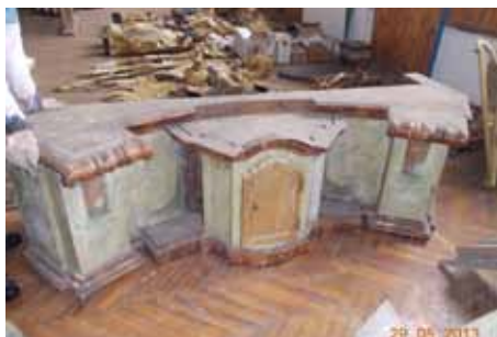
rozebraný oltář v depozitu

do tří samostatných etap. První etapa, ve které byla restaurována oltářní architektura nad hlavní římsou včetně hlavní římsy, sochařská a řezbářská výzdoba v části nad hlavní římsou včetně prvků nad oltářním obrazem a plastiky andělů z dolní části oltáře, byla zahájena v roce 2011. Na provedení této etapy přispělo Ministerstvo kultury ČR částkou 256.000 Kč, finanční podíl města činil 268.700 Kč. V roce 2012 byly ve II. etapě restaurování hlavního oltáře provedeny práce v prostoru mezi hlavní římsou a spodní římsou (mimo již zrestaurovaného oltářního obrazu). Ministerstvo kultury ČR přispělo 206.000 Kč, finanční podíl města činil 291.040 Kč. Restaurátorské práce hlavního oltáře byly dokončeny III. etapou realizovanou v roce 2013. Závěrečná etapa zahrnovala restaurování v prostoru pod spodní římsou,