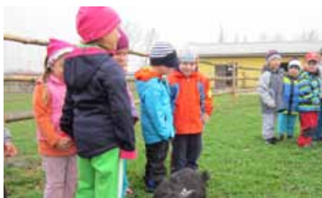
Děti a učitelky MŠ Školní

Poslední březnový den se děti z naší mateřské školy vydaly na výlet. Společně jsme navštívili školní statek v Chebu, kde na nás čekalo překvapení. Mohli jsme si prohlédnout a pohladit všechna domácí zvířata a jejich mláďata, která na statku žijí. Děti se dozvěděly, jak zvířata žijí, co jedí a jak se o ně mají lidé správně starat. Velkým zážitkem pro děti byla čerstvě vylíhnutá kuřátka, která si mohli pohladit a podržet v ruce. Ze statku jsme odjížděli plni dojmů, o které se děti podělily se svými nejbližšími. Jaro jsme přivítali opravdu netradičním způsobem.