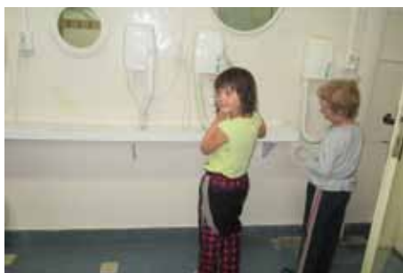
Děti a učitelky MŠ U Pivovaru