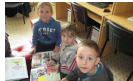
Děti a učitelky MŠ U Pivovaru