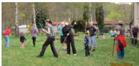
Děti a učitelky MŠ Školní

Děkujeme všem rodičům, kteří přišli pomoci v úterý 8. 4. 2014 s úklidem školní zahrady ve Školní ulici.