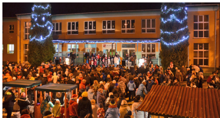
Zpívání u vánočního stromu