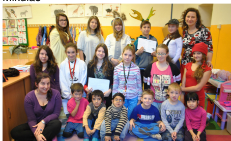
Děti čtou dětem