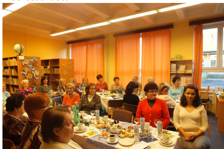
Setkání pracovníků školy s bývalými kolegy