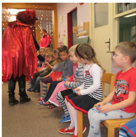
Děti z MŠ U Pivovaru