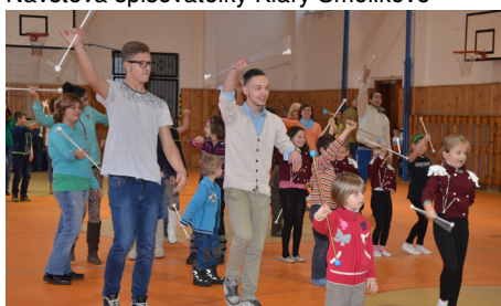
Děti z Dětského domova v Horním Slavkově