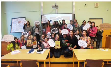
Návštěva spisovatelky Kláry Smolíkové