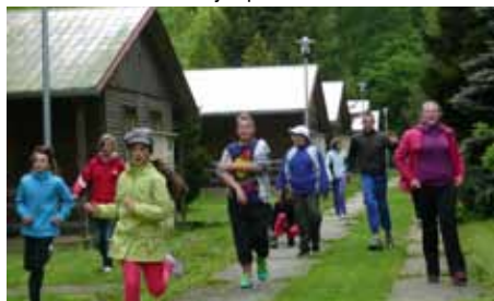
Projekt - Inovace rovných příležitostí dětí se SVP na ZŠ Kynšperk