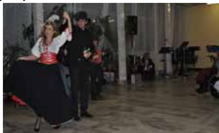
15. ples třetího tisíciletí