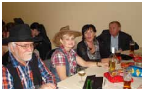
Kolektiv učitelů ZUŠ Kynšperk n.O.

Už máme vymyšlené téma na příští rok a moc se těšíme.