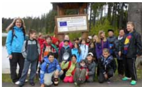
Projekt - Inovace rovných příležitostí dětí se SVP na ZŠ Kynšperk