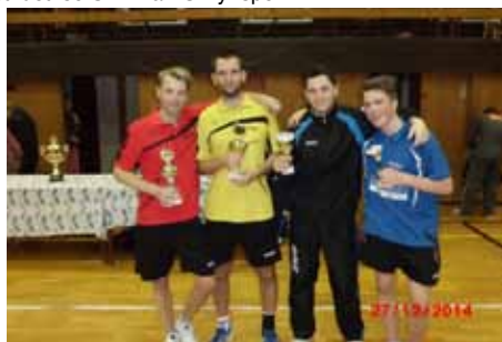
Na závěr roku výborný tenis