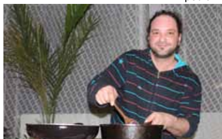
Expediční kamera poprvé