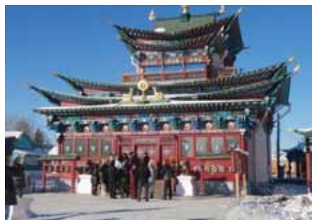
Chrám Ivolginský dacan