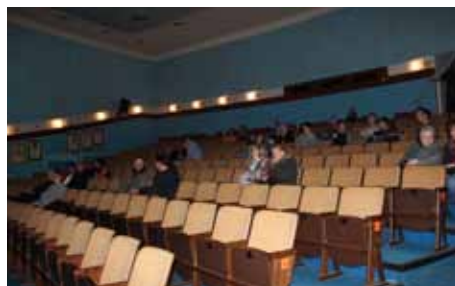
Expediční kamera poprvé