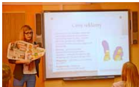
Učíme se žít zdravě a bezpečně