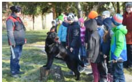
Učíme se žít zdravě a bezpečně