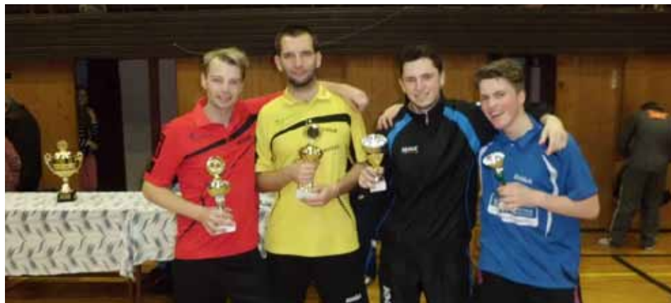
Fotografie z turnaje O putovní pohár města - prosinec 2014