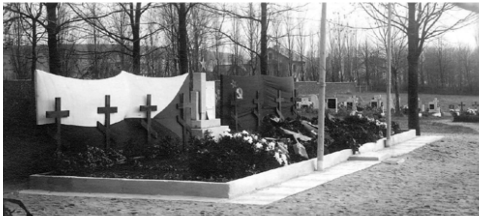
Hrob postřílených zajatců – 1. úprava z roku 1946 – asi jarní měsíc