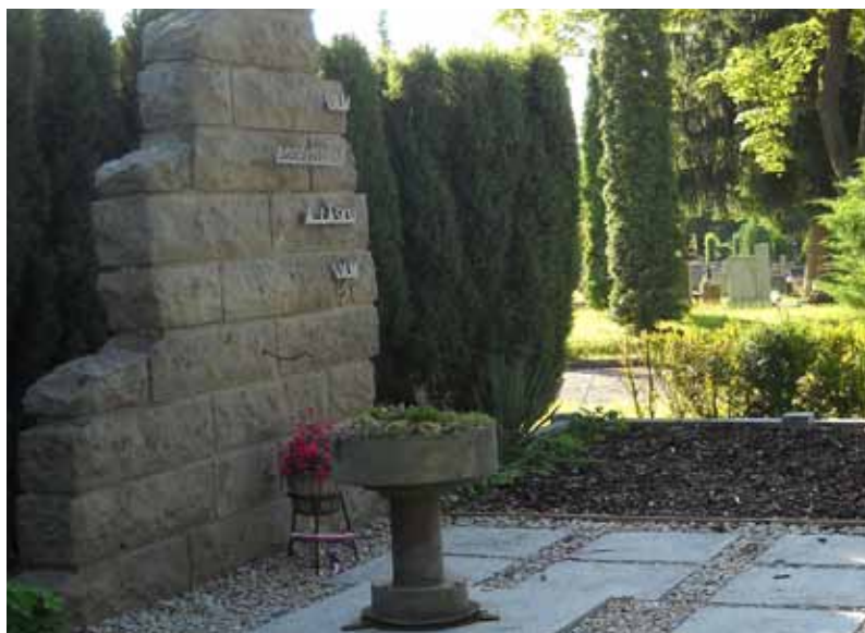
Nová úprava hrobu zajatců – září 2014