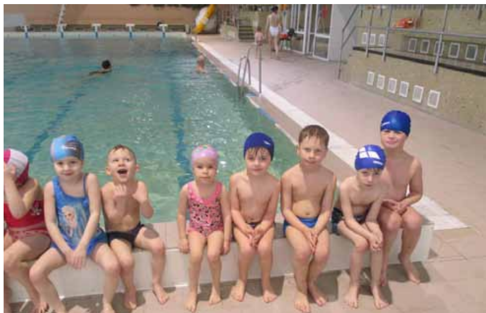
Děti z MŠ U Pivovaru