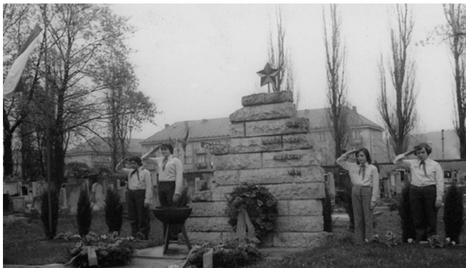
Úprava hrobů podle návrhu O. Šišky po r. 1975