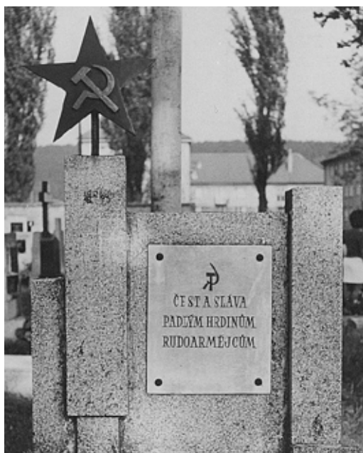
Původní vzhled náhrobní desky z roku 1946