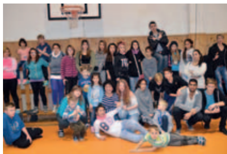
Setkání dětí z Dětského domova