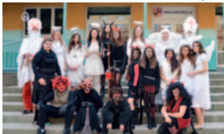
Mikuláš ve škole