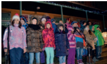
Zpívání u vánočního stromu