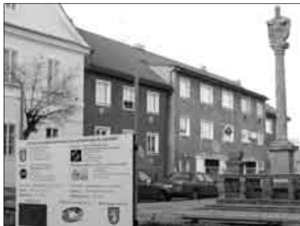
Na informačních tabulích, které se objevily v centru města, se můžete dočíst kdo financuje a které firmy opravují kostel a přístupové cesty k historickým památkám.