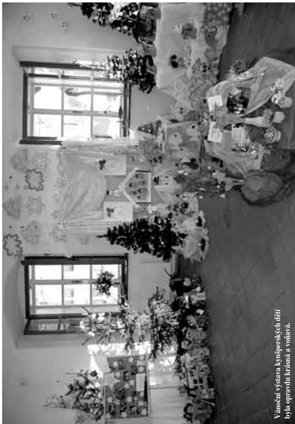
Vánoční výstava kynšperských dětí byla opravdu krásná a vonavá.