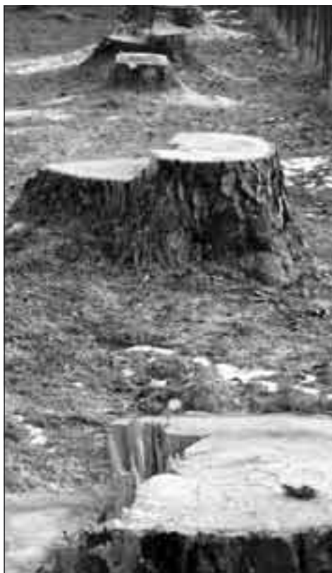
Padly další poškozené stromy po letní vichřici.