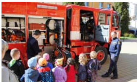
Duben – měsíc bezpečnosti