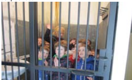
Včas umět a znát je napořád