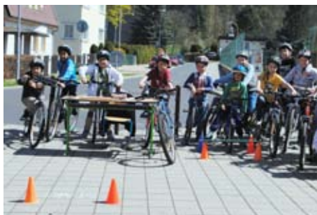
Duben – měsíc bezpečnosti