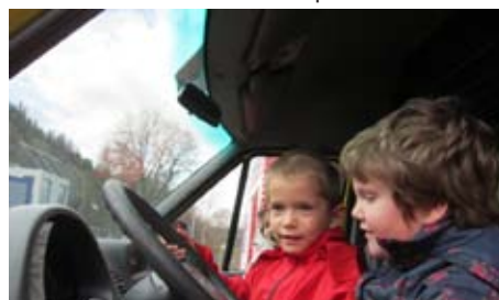
Včas umět a znát je napořád