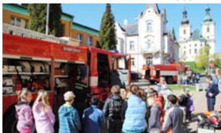
Duben – měsíc bezpečnosti