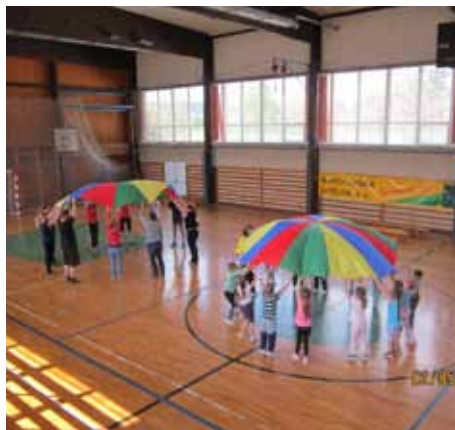
Děti a učitelky MŠ Školní

Cvičení a sportování je nedílnou součástí zdravého vývoje dětí, a proto touto cestou děkujeme vedení TJ Slavoj za možnost využívat prostory tělocvičny s dětmi z Hvězdičkové třídy MŠ Školní a Zvonečkové třídy MŠ Zahradní. Poděkování patří i paní správcové, která se svědomitě starala o naše cvičební podmínky.