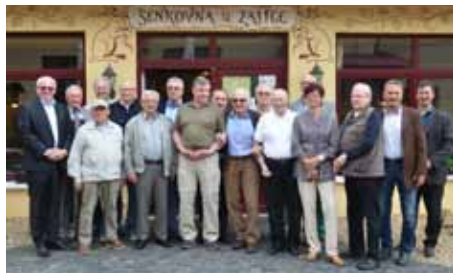
Setkání sportovních legend