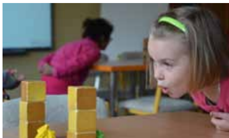
Každý jsme jiný