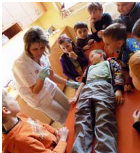
Učitelky MŠ Školní