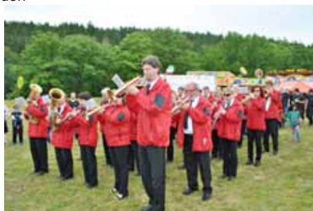
Letní slavnosti města