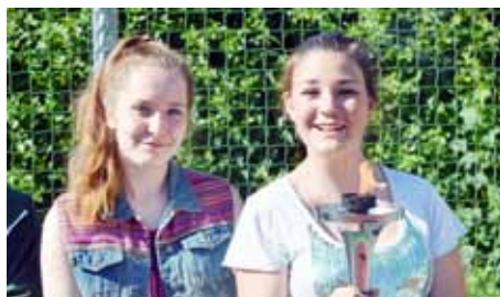
Mírová pochodeň v Kynšperku nad Ohří