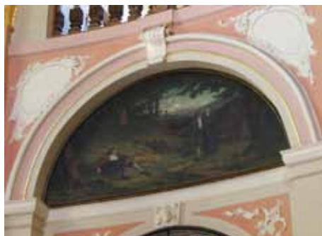
Obr. 1 – Obraz nalezení chlumské sošky v kapli Milostivé Panny Marie

V roce 2016 oslaví Kynšperk nad Ohří 730 let od příchodu Rytířského řádu Křížovníků s červenou hvězdou, kteří od roku 1286 započali zdejší duchovní správu. Tento český řád, významně zastoupený nejen v západních Čechách, nýbrž i v sousedním historickém Chebsku, se zasloužil také o vznik a rozvoj nedalekého poutního místa na Chlumu Svaté Maří, k němuž je město v současnosti přifařeno. V srpnu tak zdejší farnost oslaví hned dvakrát slavnost Nanebevzetí Panny Marie, jež je patrocinie kynšperského filiálního kostela, stejně jako farního kostela na Chlumu. Slavnost tradičně spojená s tzv. egerlandským modlitebním dnem, je dnes nejvýznamnějším česko-německým setkáním na Chlumu, jež vzdor nešťastným událostem 20. století spojuje rozdělené a překlenuje diskontinuitu kulturněhistorického vývoje našeho regionu. Letos je oslava Nanebevzetí Panny Marie přesunuta na neděli 14. srpna a všichni přichodí se mohou těšit na nevídanou lidovou slavnost.