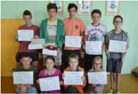
Reprezentovali ZŠ i město