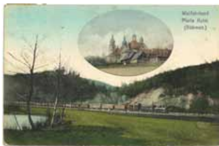
Obr. 3 – Nákladní vlak Buštěhradské dráhy pod Chlumem Svaté Maří na pohlednici z poč. 20. stol.

při jeho dopadení. Na slavnosti pořádané na hradě pak rozpozná mezi hosty hledaného lapku, s nímž si domluví schůzku, během níž jsou lupiči obklíčeni a zajati. Ještě v polovině 19. století tak prý byla návštěvníkům proboštsví ukazována „zaručeně původní“ šachovnice, pro niž se kdysi Bibiana vydala do temných chlumských lesů.