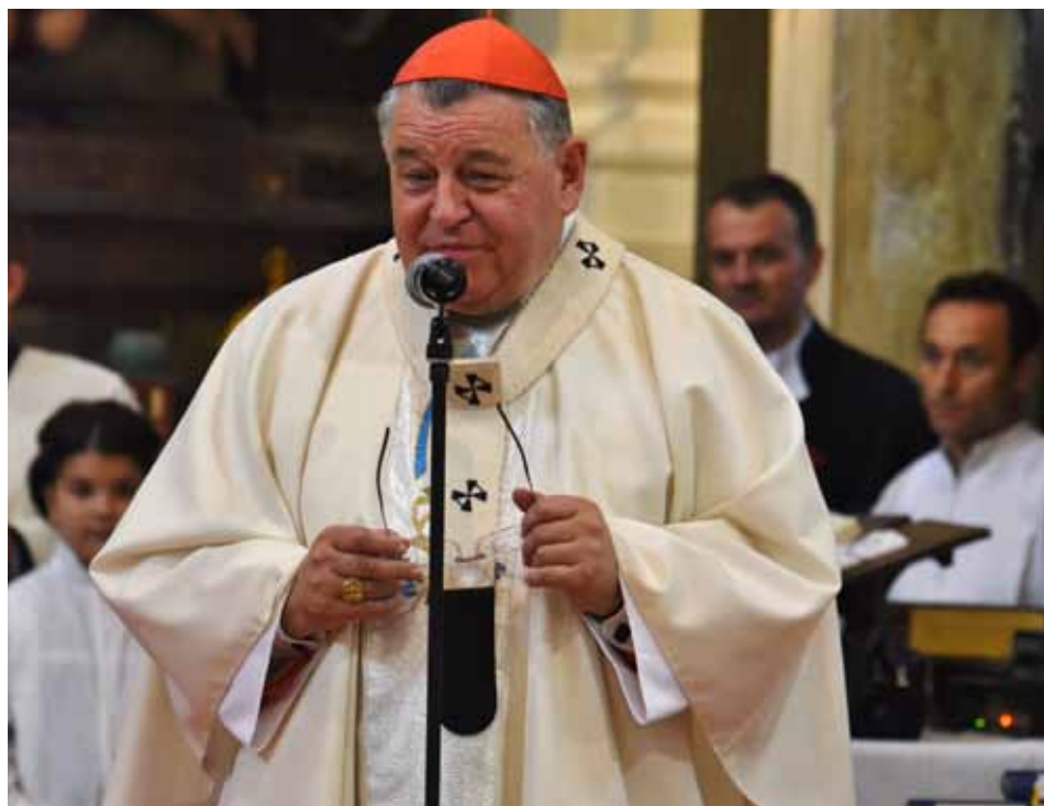
Obr. 4... – Fotografie z loňské slavnosti Nanebevzetí Panny Marie 15. 8. 2015, které se zúčastnil také J. E. kardinál Dominik Duka, arcibiskup pražský