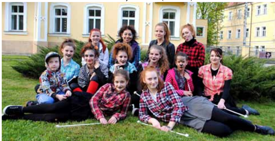
Pálení čarodějnic - Františkovy Lázně