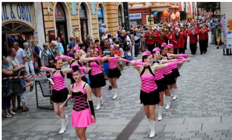
Fijů Cheb 2016 - průvod městem