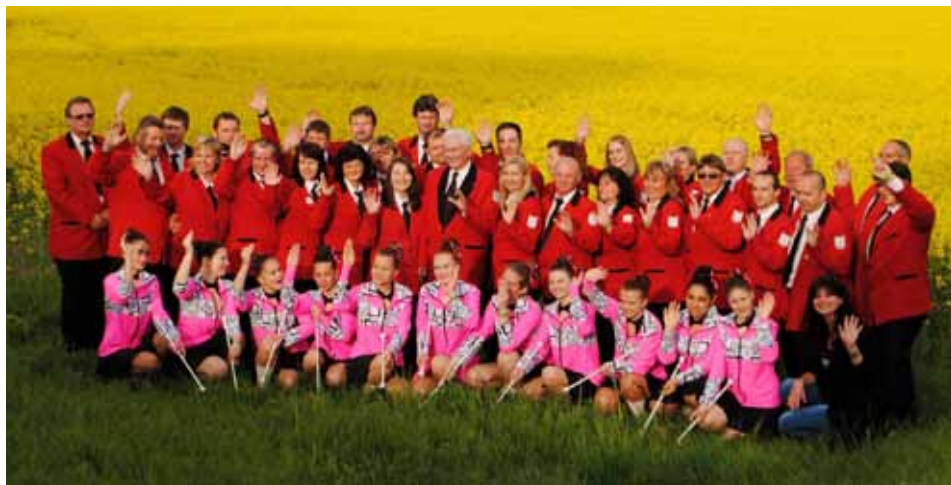
Pozdrav z cesty do Thumu (Německo)