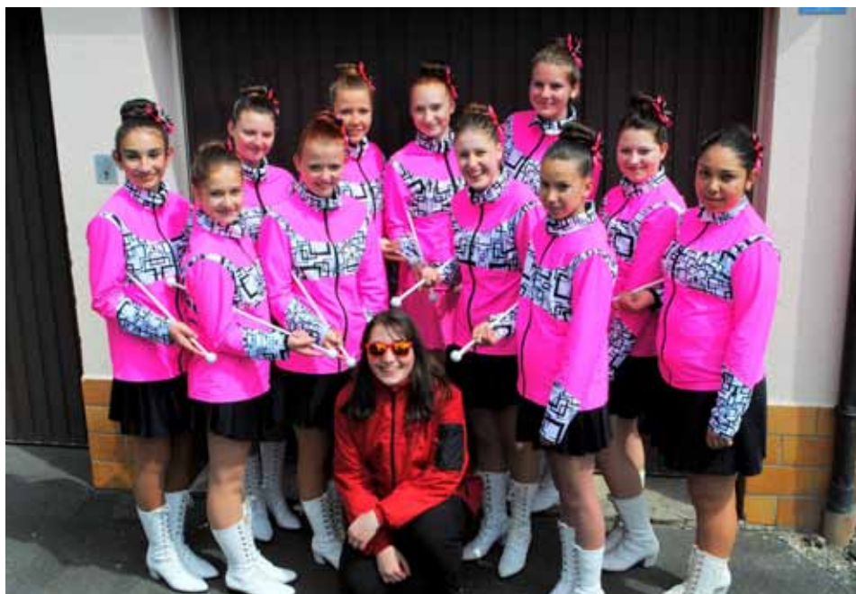
Naše šikovná děvčata s nejmladší členkou Městské hudby - Himmelkron 2016