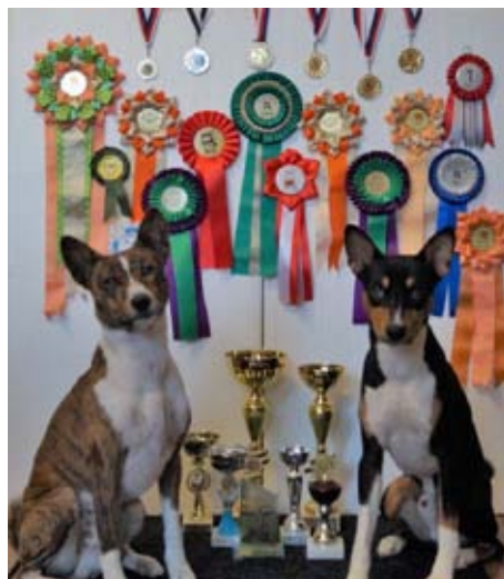
Coursing a výstavy Rony a Dumi 2016