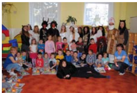
Mikuláš ve školce