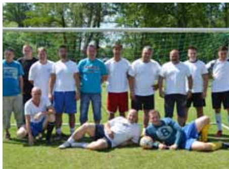
Juventus Libavské Údolí