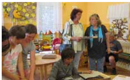
Loučení s mateřskou školou