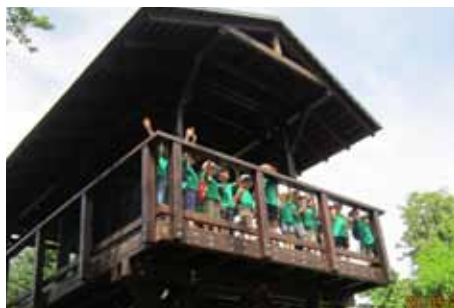
Za sportem a poznáním