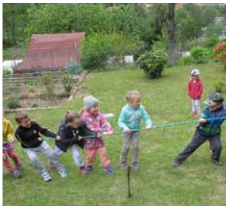
Děti z mateřské školy U Pivovaru