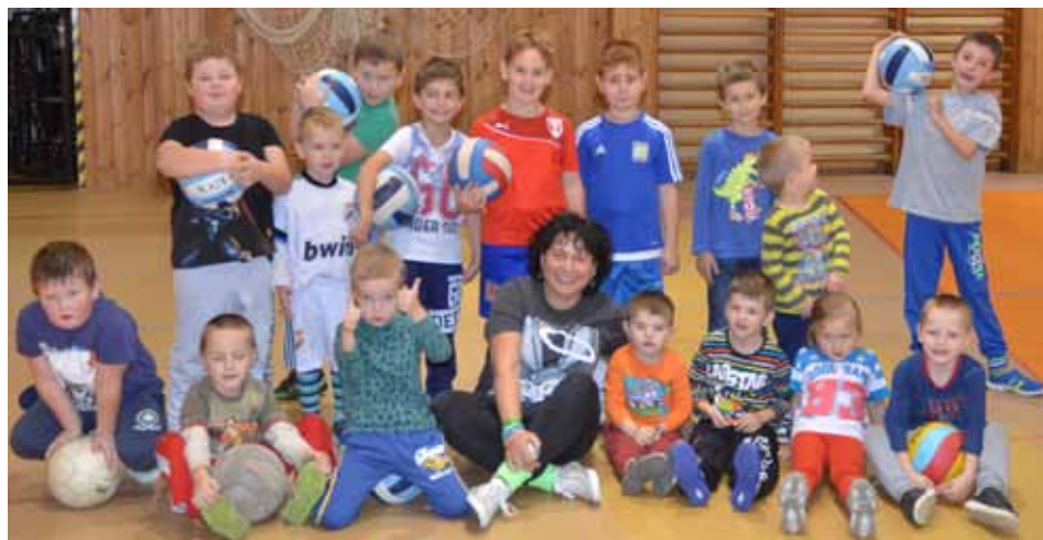
Kopaná Elev - nejmladší