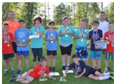
Kopaná st. příprava