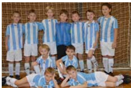
Kopaná ml. příprava

Dům dětí a mládeže při základní škole připravuje pro školní rok 2017/2018 nabídku zájmové činnosti pro děti našeho města a blízkého okolí. V letošním roce jsme nabídli 28 zájmových útvarů, v nichž chceme pokračovat a rozvíjet dovednosti dětí i v novém školním roce. Podle provedeného průzkumu mezi žáky je největší zájem o sportovní a pohybové aktivity jako je kopaná, sebeobrana, florbal, volejbal, mažoretky. Objevily se i návrhy pro nové kroužky: