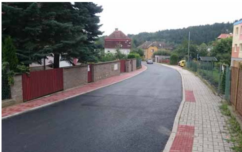
Oprava Zahradní ulice za 3,5 miliónu korun (foto potom)