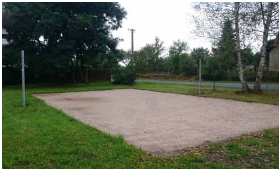
Oprava dětského hřiště v Liboci za 200 000,- Kč