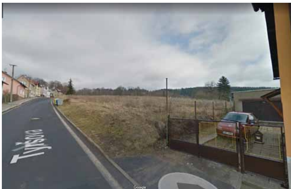
Budování druhé etapy Třešňovky v celkové částce 8,3 miliónu korun