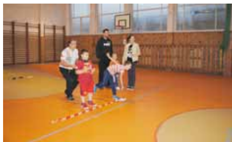
Na školní rok 2017/2018 jsme připraveni, na děti a žáky se těšíme