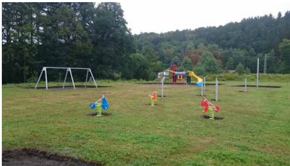
Budování nového centrálního dětského hřiště na sportovním areálu za 1 milión korun