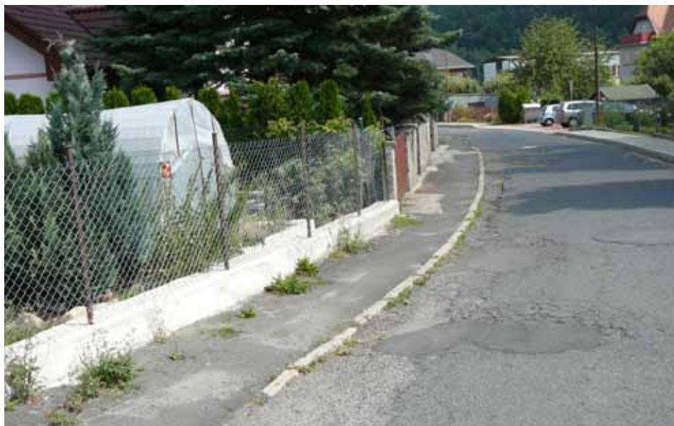
Oprava Zahradní ulice za 3,5 miliónu korun (foto předtím)