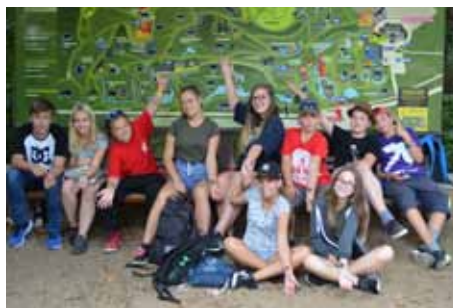
Výlet na Safari