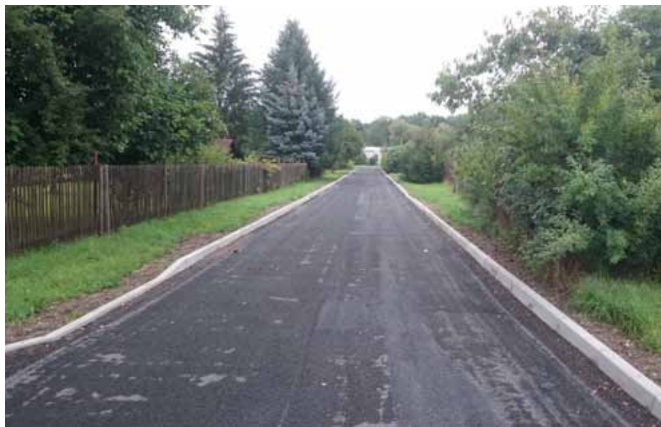
Oprava Hornické ulice za 400 000,- Kč