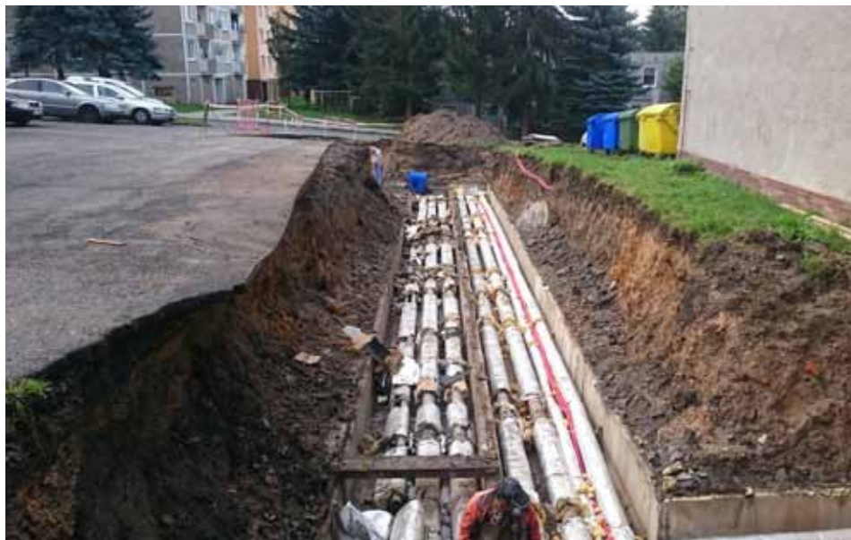
Výměna teplovodního kanálu v ulici U Pivovaru v celkové výši 1,7 miliónu korun