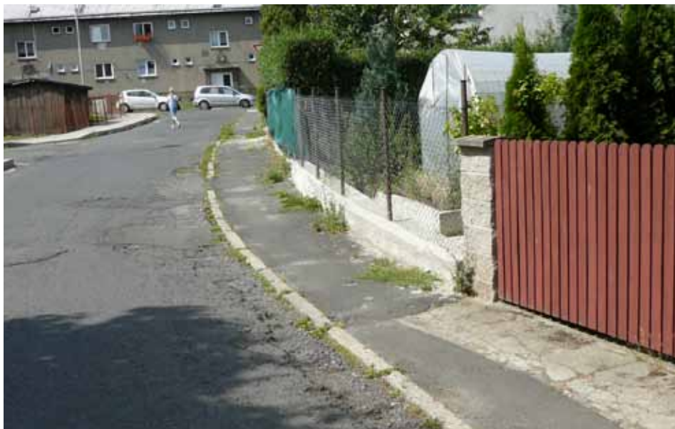
Oprava Zahradní ulice za 3,5 miliónu korun (foto předtím)