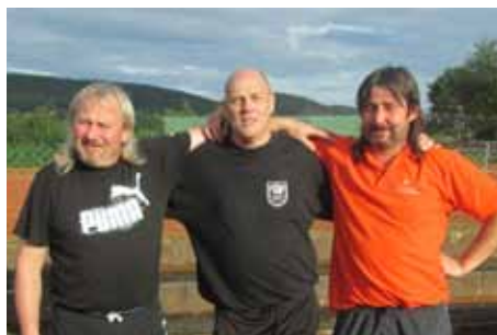
Kynšperští tenisté sehráli přátelské utkání