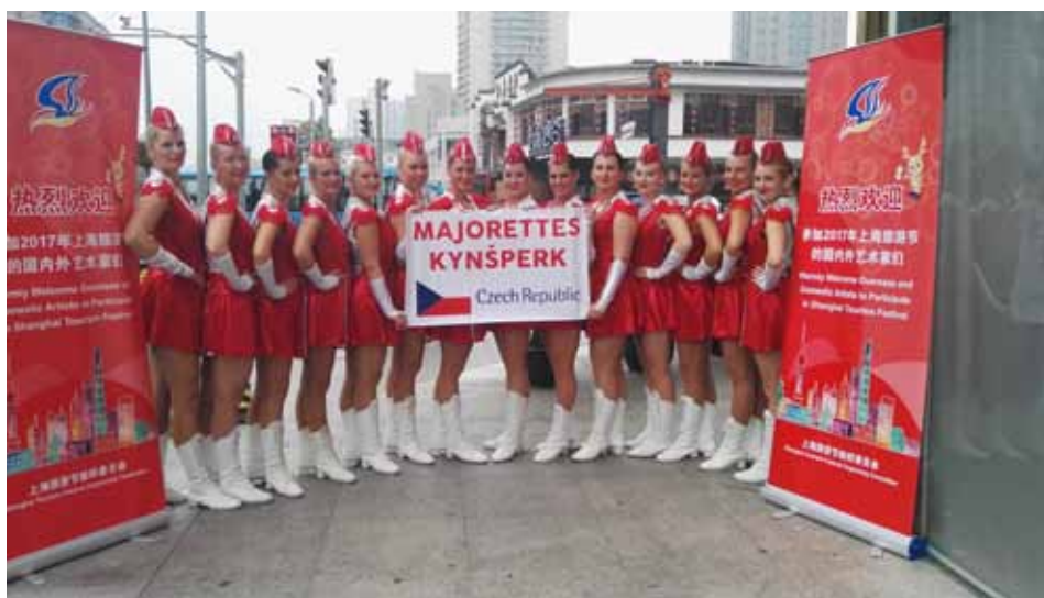
Majorettes Kynšperk v Šanghaji