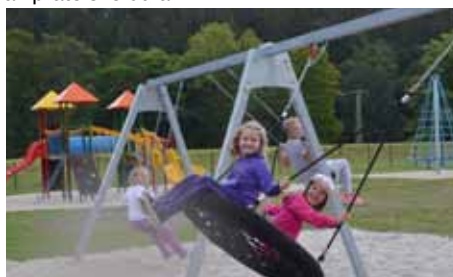
Nová dětská hřiště pro naše malé děti