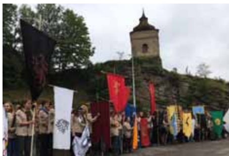
Celorepublikové kolo skautského...