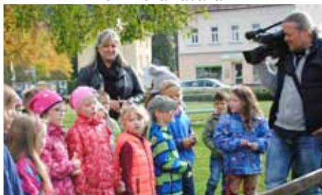
Nový vánoční strom