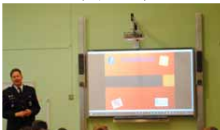
Tematický den Osobní bezpečí