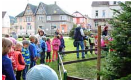
Nový vánoční strom