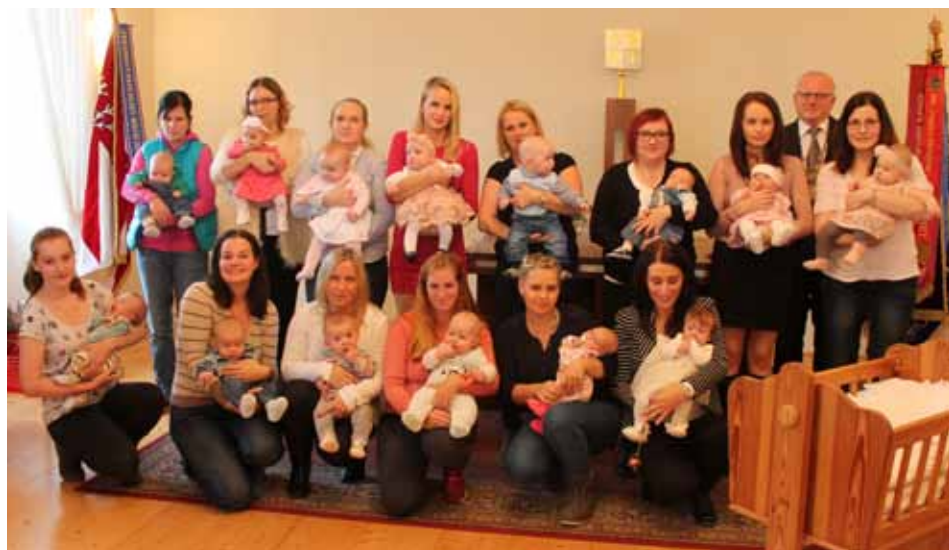
(fotografie si rodiče dětí mohou vyzvednout u p. Kutíše v bývalé trafice vedle restaurace Koruna)

Za správní a sociální odbor Bc. Alena Kadavá