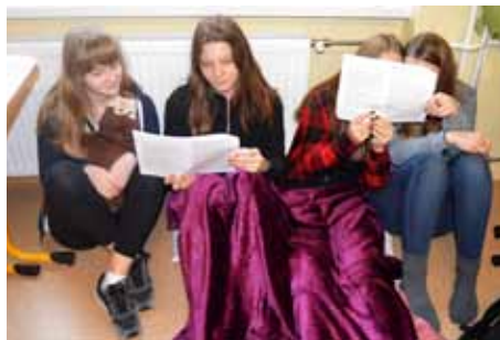
členky čtenářského klubu

Na konci dne bylo vedením školy pográtováno všem pedagogům k jejich dnešnímu svátku Dni učitelů, k tomuto přání bychom se jako žáci této školy chtěli připojit a také pográtovat.