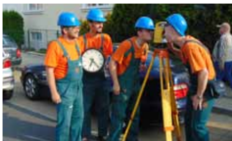
Botas - Geodeti