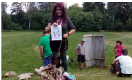
Voříškiada – Nejkrásnější voříšek