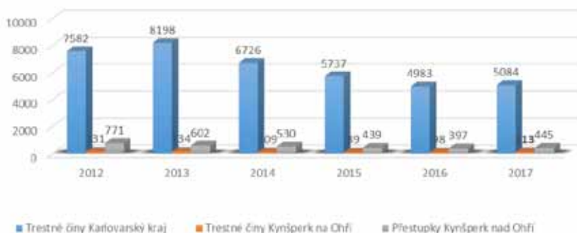
Vývoj kriminality v Karlovarském kraji a Kynšperku nad Ohří