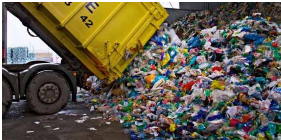
Ilustrační fotografie - www.jaktridit.cz