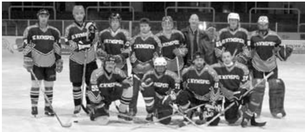
Kynšperští hokejisté v nových dresech, které získali od města.