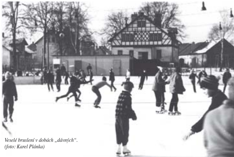
Veselé bruslení v dobách „dávných“.