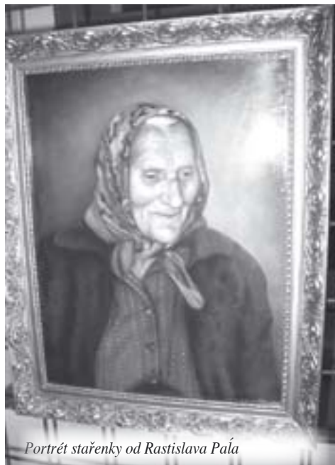
Portrét stařenky od Rastislava Paľa

Více fotografií najdete ve fotogalerii MKS pod www.kynsperk.cz - městské organizace.