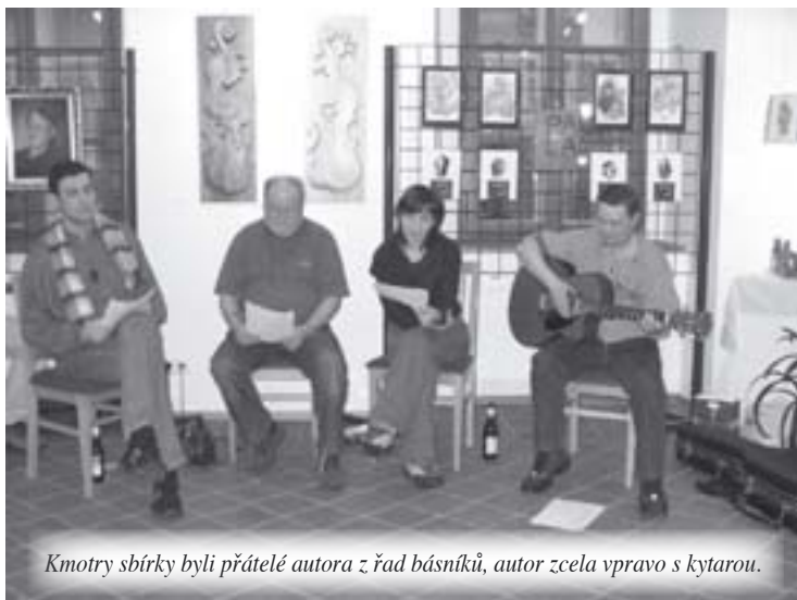
Kmotry sbírky byli přátelé autora z řad básníků, autor zcela vpravo s kytarou.