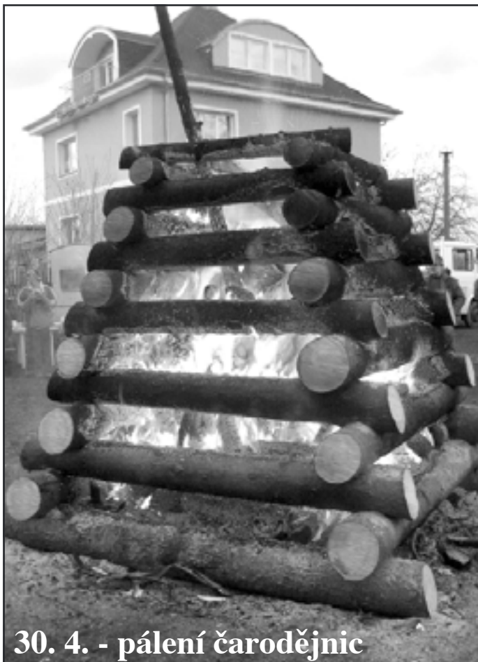
30. 4. - pálení čarodějnic