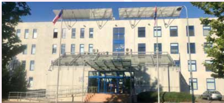
Hlavní budova Krajského úřadu Karlovarského kraje, KV, 2020