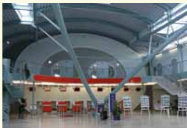
Odbavovací hala letiště, 2009