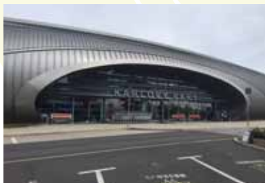
Letiště Karlovy Vary, 2017