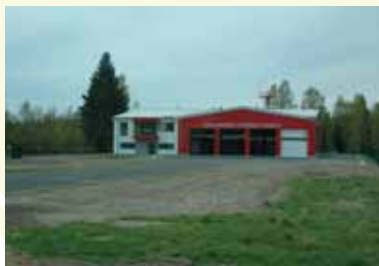
Objekt požární záchranné služby Letiště Karlovy Vary, 2017