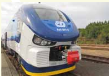
Vlaková souprava REGIOSHARK, 2012