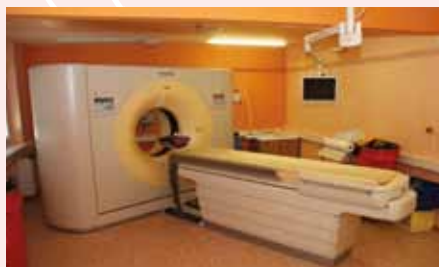
Počítačový tomograf za 28 milionů korun, Karlovy Vary, 2010