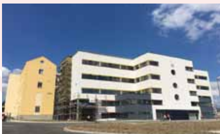
Nemocnice Cheb, 2018