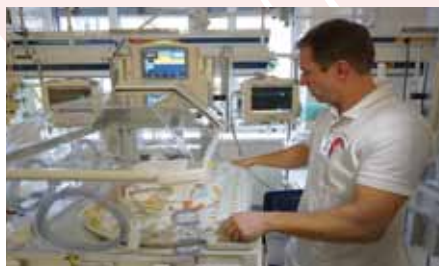
Multifunkční inkubátor, Karlovy Vary, 2018