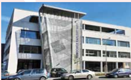
Pavilon akutní medicíny v Nemocnici Karlovy Vary, 2012