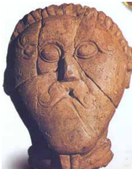
Proslavená Keltická hlava z Mšeckých Žehrovic

Sarmaty) kdesi u Dněpru. Další římský dějepisec Tacitus ve svých Letopisech r. 98 jmenuje jakési Venety východně od Visly (Vistuly), o nichž neví, zda je řadit ke Germánům či k Sarmatům. Alexandrijský učenec Klaudios Ptolemaios v polovině 2.století umísťuje Venedy či Venety mezi Vislu, Dněstr a Dněpr. Koncem 2.století popisuje Aurelius „ještě vzdálenější barbary“ zpoza Visly. Druhá větev podle pozdějších písemných záznamů přesídlila do Podunají - r.512 píše Prokopios z Kaisareie o germánském kmeni Herulů, který se po porážce od Langobardů vrací z dolního Podunají do své původní vlasti na dolním Labi a putuje přese všechny slovanské národy, cca 550 Iordanes Gót (píše o velkém národu Venethů na západ od Dněstru, kteří se ovšem sami nazývají především „Sklavinny a Anty“) a také arabský učenec Pseudo-Movses Chorenací - nejjižnější větev za-