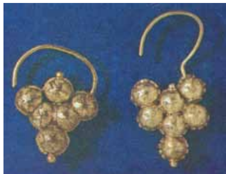
Gombíky s barevnými očky a zlaté bubínkové náulnice zdobené granulací z pohřebiště u Jizdířny Pražského hradu, 9. st.

mířila i na Balkán. Krátká existence Samovy říše (623 – 658 n.l.), která vznikla po povstání Slovanů proti Avarům, je doložena v kronice tzv. Fredegara - ten je jmenoval „Slované (lat. Sclavos), zvaní Vinidé“. Po rozpadu tohoto prvního slovanského „státního útvaru“ se zřejmě naši předci pod novým tlakem avarských nájezdníků posunuli z Podunají dále na severozápad, až se nakonec dostali až do krajů podél řeky Ohře. Tak, a teď již máme naše slovanské předky tak říkajíc za humny a příště se již můžeme vrhnout přímo na Kynšperk.