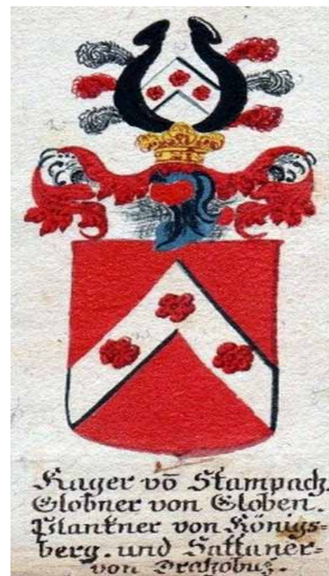
1700 ca- Kager_von_Stampach, Globner, Plankner

tě roku 1522 stihl Jetřichovým bratřím (od r. 1513) potvrdit privilegia a udělit právo užívání nové městské pečeti, ale pak se již dostali Gutštejnové kvůli různým právním i násilným deliktům na „černou listinu“ u dvora, takže museli rostoucí finanční i společenské problémy vyřešit v letech 1521-23 buď prodejem, nebo více či méně nedobrovolným postoupením zástavního práva na Kynšperk stále mocnějším a zpupnějším Šlikům (druhá varianta mi připadá pravděpodobnější). Abych předešel nařčení z podjatosti vůči Šlikům, je třeba říci, že