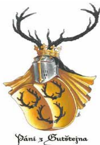
16. stol.- Gutštejnové

až do konce 15. století. Jako u ostatních potomků Kagerů tvořila figuru v červeném štítu stříbrná krokev se třemi pětistými, tentokrát červenými růžemi, ve vrcholu i obou břevnech po jedné. V klenotu byly dva buvolí rohy s nátrubky, mezi něž je opět umístěna figura ze štítu, přikrývadla jsou červenobílá. Při povýšení do panského stavu r. 1629 byl erb polepšen o erb malesických, r. 1676 při povýšení do stavu hraběcího přibyla příslušná korunka a opět pochopitelně atributy v té době již vymřelého rodu z Malesic. Bylo by vhodné připomenout i erb Globnarů, kteří sice sídlili v Globenu (dnešní Hlavno) a v Kynšperku nezanechali téměř žádnou stopu, ale patřili do koruny stejného genealogického stromu jako Planknarové a Štampachové, navíc ve spojení se Štampachy o nich uslyšíme ještě v 18. století (!!!). Jejich erb nesl sice stejné prvky jako ostatní dvě rodové větve, ale výrazně barevně odlišené. Štít Globnarů byl zlatý, krokev v něm byla červená a růže stříbrné, buvolí rohy v klenotu i přikrývadla byly opět zlaté. Pro pořádek ještě musím zmínit poměrně významný regi-