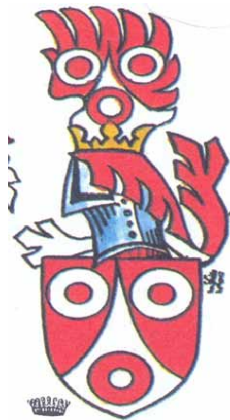
16. stol.- Schlick z Holíče

Mezi lety 1434 až 1437 začíná snad nejzajímavější a nejdramatičtější období v historii Kynšperku, pokud pomineme třicetiletou válku. Císař Zikmund, poslední Lucemburk na českém trůnu, byl po létech husitských válek finančně na dně a aby zalátal díry ve svém měšci, začal za půjčky rozdávat nalevo napravo zástavní práva, a to i na do té doby nedo-