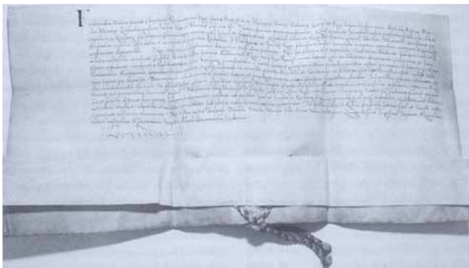
Právo zděných hradeb, potvrz. privilegii