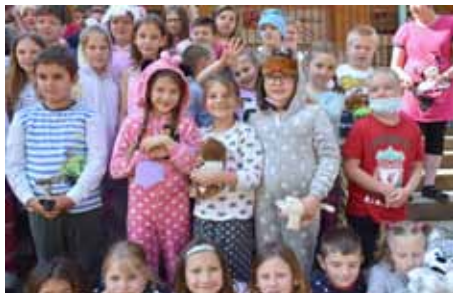
Naši noví obyvatelé Kynšperka