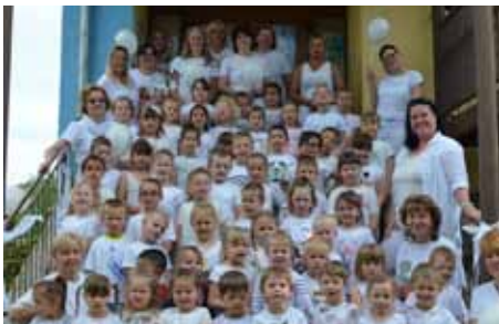
Barevný týden v MŠ