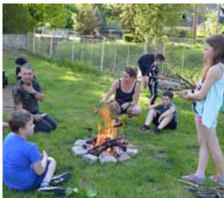
Kolektiv DDM J + T + J

V pátek 4. června jsme připravili pro děti nocování u školy. Společně s dětmi jsme postavili stany, připravili karimatky a těšili se na noc plnou hvězd. K večeři jsme si opékali buřty na školní zahradě, hráli různé hry a nechyběla ani pohádka na dobrou noc. Někdo spal ve stanu a ti odvážnější pod širákem. Snídaně byla bohatá. Rohlík s nutelou, se sýrem, s paštikou nebo s marmeládou a čaj. Po snídani jsme sbalili stany a zastříleli si ze vzduchovky. Nakonec jsme se rozloučili a šli spokojeni domů. Děkuje všem zúčastněným i rodičům za pomoc při opékání a těšíme se na další akci. V pátek 11. června nás čeká pyžamový den.