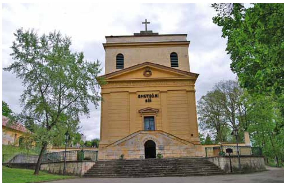
Hrobka Metternichů v Plasech