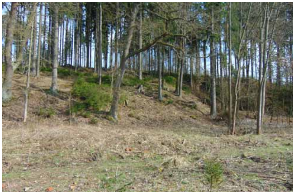
2020 – zde stával kostelík sv. Uršuly se špitálem