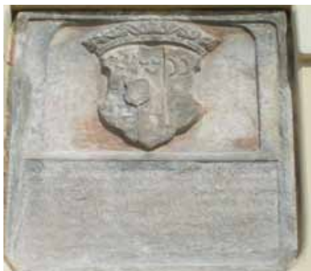
1650 ca - Metternich.erb, Kynšperk

burkové po porážce stavovského potlačovat byt i jen zbytky luteránského vyznání. Podle doktríny buď emigrovat, nebo přestoupit ke katolictví, kterou Metternichové důsledně dodržovali, zřejmě značná část obyvatel prchla do protestantského Saska a zbytek konvertoval k v té době již jedinému povolenému katolickému náboženství.