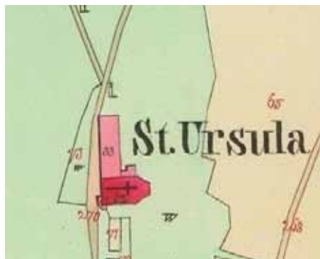
1841 – katastr