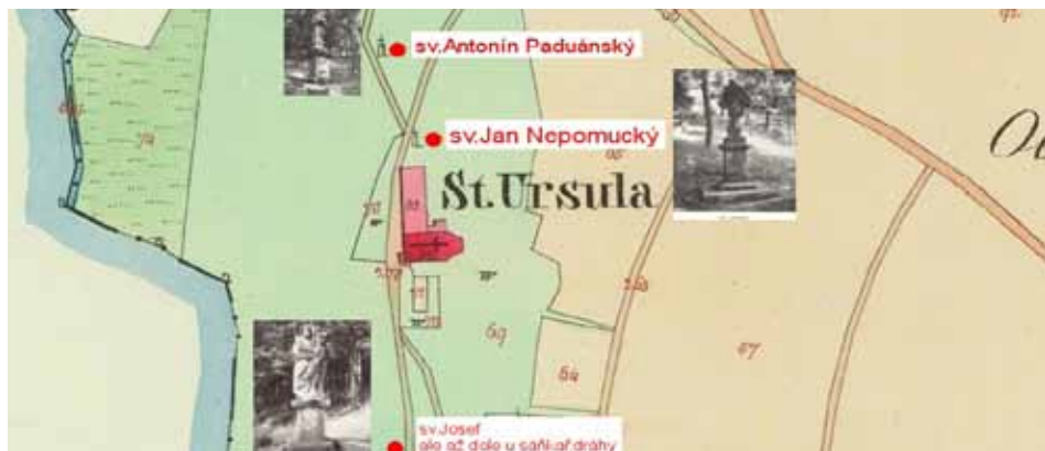
sochy, katastr – 1841

vytesán nápis o renovaci (13.11.1894). Socha světce, spočívající na jednoduchém sloupu, byla natolik poškozena diletantskou opravou po roce 1946, že nebylo možné ji restaurovat a byla roku 2001 nahrazena kopií - původní socha je ve sbírkách chebského muzea.