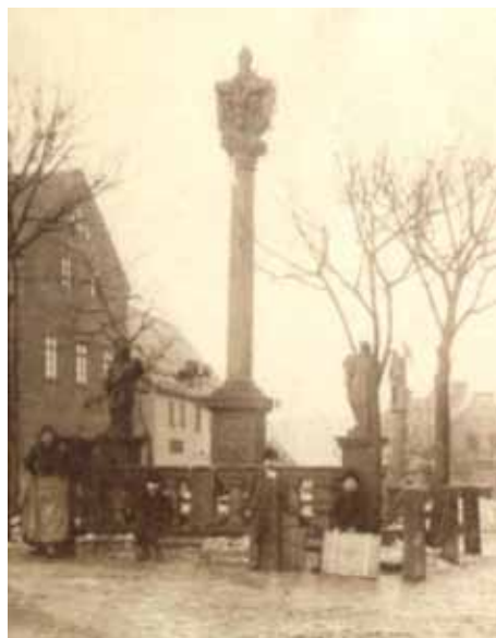
Trojč. sloup – 1908