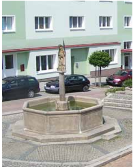
sv. Florian – 2011