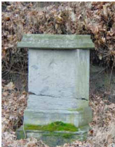
sv. Jan u pivovaru - 2015