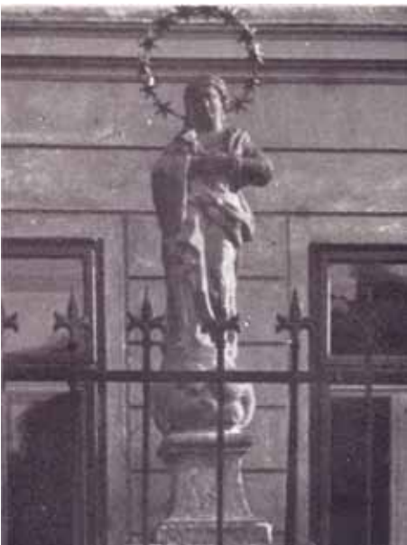
Immaculata – 1931