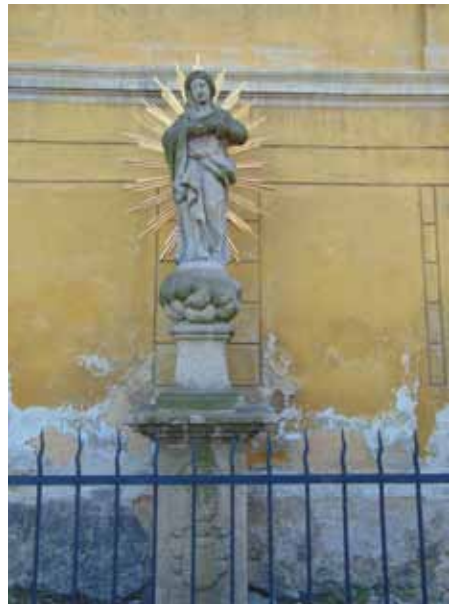
Immaculata - 2015