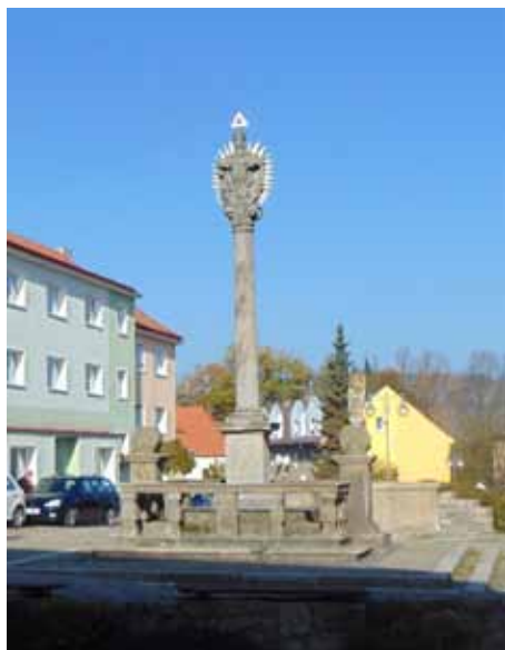
Trojč. sloup - 2014