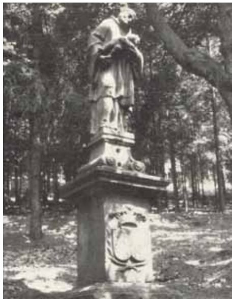
sv. Antonín – 1932