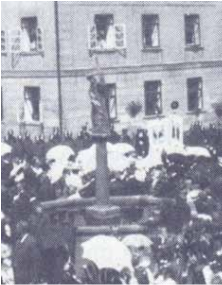
sv. Florian – 1910