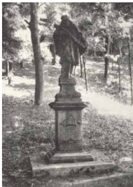
sv. Jan Nepomucký – 1932