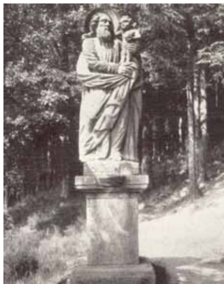
sv. Josef – 1932