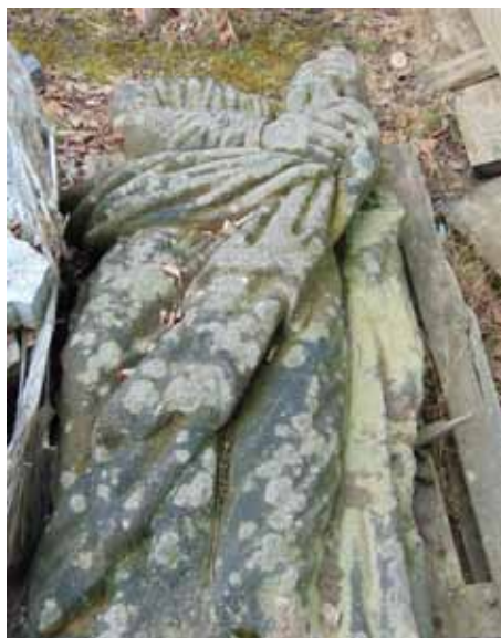
sv. Josef – 2018