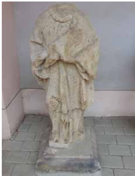
sv. Antonín - 2016

Výše zmíněný požár, který vznikl neopatrnou manipulací jakéhosi řemeslníka se žhavými uhlíky, zničil nejméně 68 domů. Po něm přichází velká rekonstrukce města, která vyvrcholila stavbou nového kostela Nanebevzetí Panny Marie v letech 1721-1727 (o něm bude příští kapitola). Mezitím se ovšem Filip Adolf velmi zadlužuje a tak Kynšperk propadá správě věřitelů. Po odškodnění věřitelů probíhá v roce 1725 ocenění majetku Filipa Adolfa, ve kterém je uvedeno, že z kynšperského hradu již zbývají jen sklepy a část ohrazeného nádvoří. Ale zpět k tehdy nově vytvořeným sochám. Při severním průčelí farní budovy byla v r.1713 postavena socha Panny Marie Immaculaty (neposkvrněného početí, též na obláčku). Na jejím soklu krom datace a erbu Perglerů jsou i iniciály donátorky C.B.P.G.V.Z.- což byla majitelka statku Nový Dvůr v Pochlovicích Catharina Barbara Pergler, Gebor. Von Zedtwitz. Současná socha je ovšem jen kopie z r.2006, originál je v lapidáriu muzea.