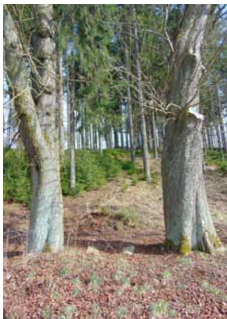
sv. Jan Nepomucký – 2020