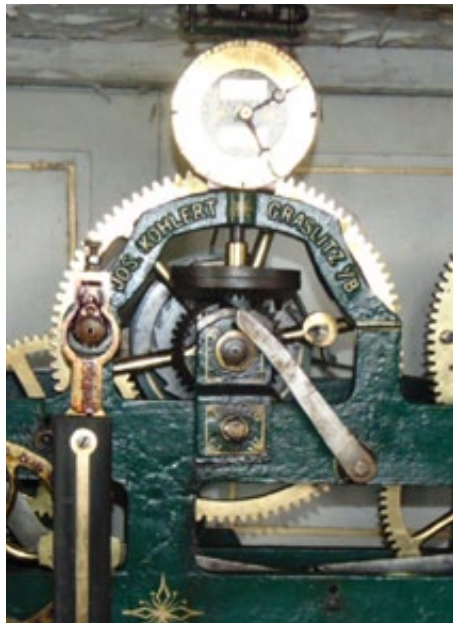
původní hodinový stroj