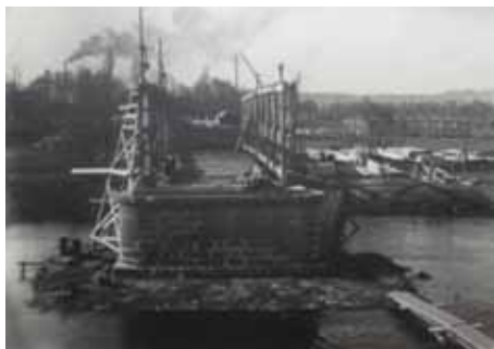
1945 – dřev. mostovka

Když se 6. května 1945 přiblížila americká armáda po pravém břehu Ohře přes Hlínovou (Klingen) a Kamenný Dvůr (Steinhof) ke Kynšperku, stáhli se Němci na levý břeh. Aby zabránili Američanům v přístupu k nádraží a dalším postupu, vyhodili tento velký most i betonovou lávku do povětří - samozřejmě, že si nacisté příliš nepomohli, pouze napáchali ohromné škody. V srpnu 1945 začaly práce na odklizení trosk zničeného železného mostu a posléze byla na zůstavších pilířích postavena mostovka dřevěná. Ta sloužila až do r.1954, kdy byl kousek po proudu postaven provizorní dřevěný most a ten dosavadní byl odstraněn.