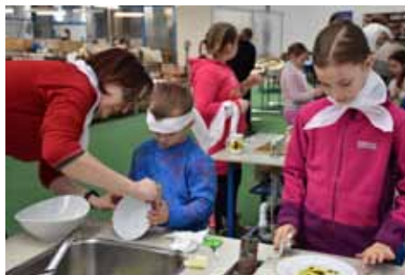
J + T + J pracovníci DDM