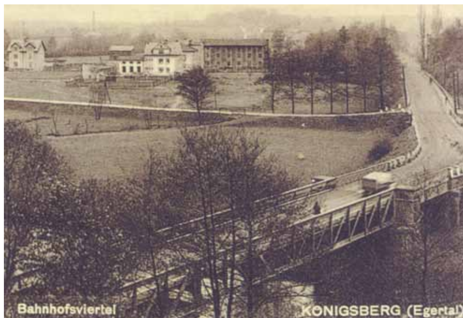
1937 – od Kukačky

V letech 1875 - 1876 proběhla stavba železného mostu na kamenných pilířích, a protože železniční zastávka v té době byla až severně od dnešního přejezdu směrem na Sokolov, přemostění bylo umístěno mimo teritorium města, asi 200m za pivovar, mj. i pro mělčí profil řeky v těchto místech. Za tím účelem byl odtěžen svah vpravo od současné silnice na Libavské Údolí a Sokolov, aby byla umožněna odpovídající komunikace k novému mostu (původní silnice do Lib.Údolí vedla dnešní Tyršovou a přes kopec, okolo bývalé kaple 14ti pomocníků). Nový most vydržel bez významnějších oprav až do r.1945, kdy vrcholily poslední boje 2.svět. války.