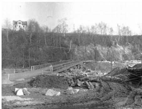
1954 – provizor. most, Kukačka