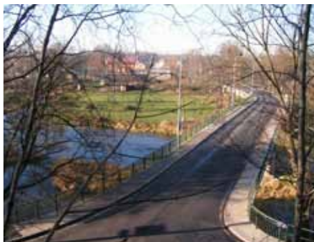
2006 – od Kukačky