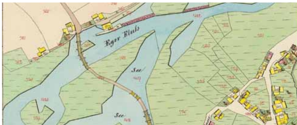
2.1845 - katastr

Proto přistoupilo město Kynšperk k radikálnímu kroku, tj. regulaci toku řeky. V letech 1923-24 byly na obou březích Ohře nasypány několik set metrů dlouhé hráze a sveden tok řeky do jednoho koryta (krom levobřežního náhonu, který byl využíván mlýnem a textilní továrnou Wild), hráze poté zabraňovaly rozlívání