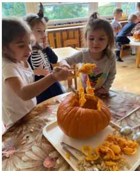
Kolektiv MŠ U Pivovaru

Společně jsme si vydlabali dýně, které nám krásně osvětlily schodiště hlavního vchodu. Školní zahrada se na jednu noc proměnila ve strašidelnou stezku lemovanou svíčkami. Celé rodiny, převlečené do halloweenských kostýmů, prošly stezkou, která byla plná záladných úkolů a tajemných příběhů. Na konci dobrodružství čekala na všechny odvážné sladká odměna.