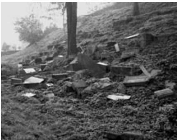
Židovský hřbitov před rekonstrukcí ...

Židovský hřbitov je pro veřejnost otevřen pondělí až pátek od 13.00 do 17.00 hodin (v letní sezóně i v neděli).