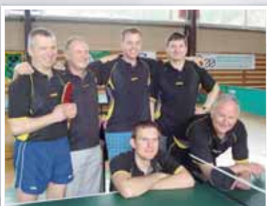
Stolní tenisté měli úspěšnou sezonu