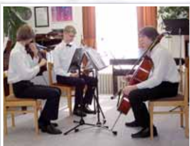
ZUŠ pořádala soutěž smyčcových nástrojů