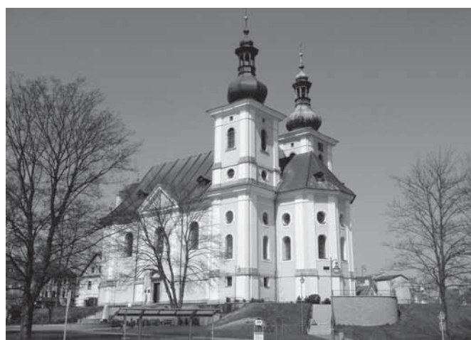
Stav kostela před rekonstrukcí (dva snímky vlevo) a v současnosti (snímky vpravo)