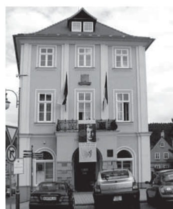
Řádné označení budov jako má např. kynšperská radnice, musejí mít od 1.7.2010 i dočasné stavby.

úřednice správního a sociálního odboru – evidence obyvatel Městského úřadu Kynšperk nad Ohří