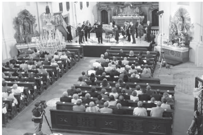
Concerto Köln v kostele Nanebevzetí Panny Marie v Kynšperku nad Ohří.