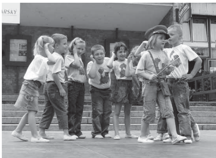
Předškoláci z mateřinky v Zahradní ulici to na Náměstí SNP v Kynšperku pořádně rozjeli. Nachystali si představení s názvem Vlášek.