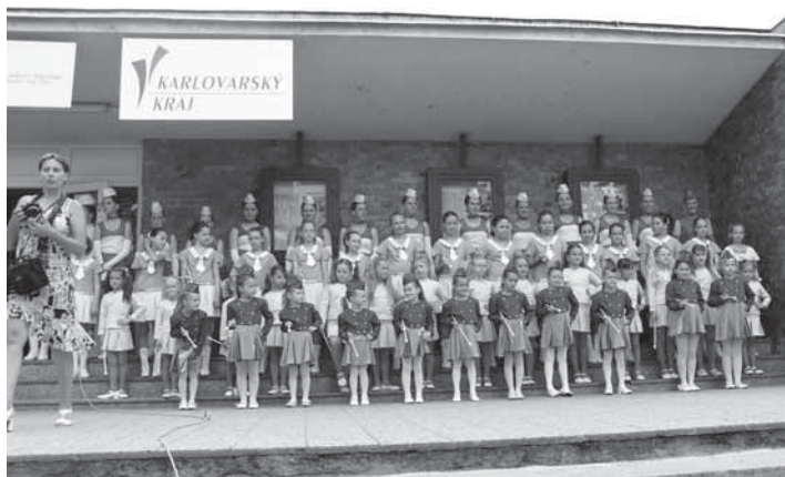
Mažoretky Základní školy Kynšperk nad Ohří.