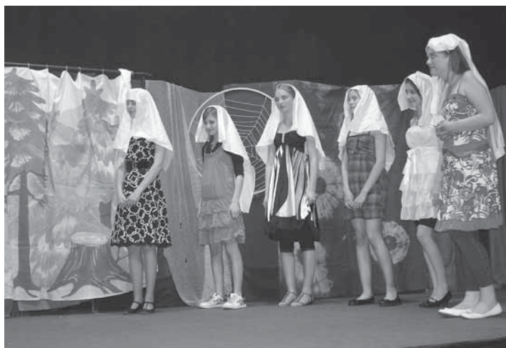
Osmnáct dětí pilně nacvičovalo pohádku O Zlatovláscu. Představení se žákům dramatického oddělení ZUŠ Kynšperk skutečně vydařilo.

Zdeňka Karbulová ředitelka ZUŠ Kynšperk nad Ohří