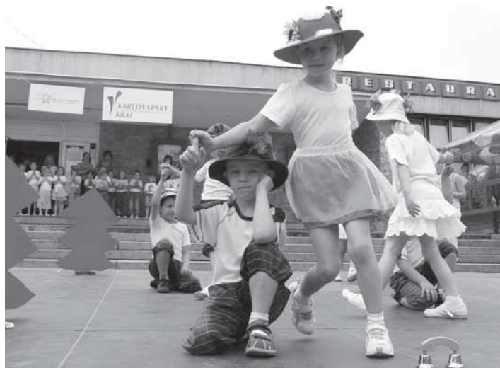
Jak má vypadat správný Kloboukový balón předvedly děti z mateřské školy v ulici U Pivovaru.