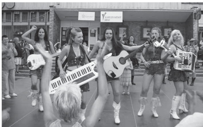
Country Sisters rozparádily kynšperské publikum.

Dne 12.6.2010 proběhly tradiční letní slavnosti města, tentokrát opět před městským kulturním střediskem.