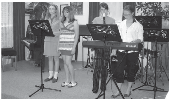
Letošní absolventský koncert se žákům Základní umělecké školy v Kynšperku nad Ohří vydal.

Dne 7. 6. 2010 se uskutečnil koncert absolventů Základní umělecké školy v Kynšperku nad Ohří. Dramaťáci měli své divadelní představení, hudebníci koncert a výtvarníci výstavu.