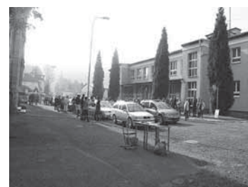
BOTASu počasí přálo.