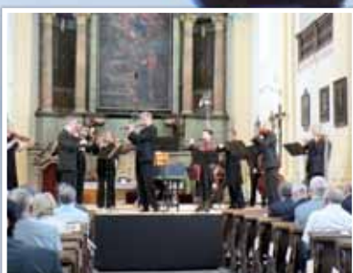
Festival Mitte Europa zahájili v Kynšperku