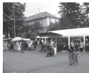
Občerstvení a atrakce samozřejmě nesměly chybět.