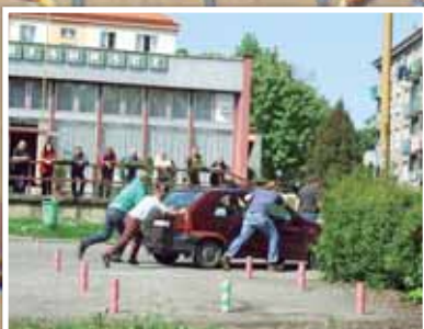
BOTASu se zúčastnilo 16 čtyřčlenných posádek