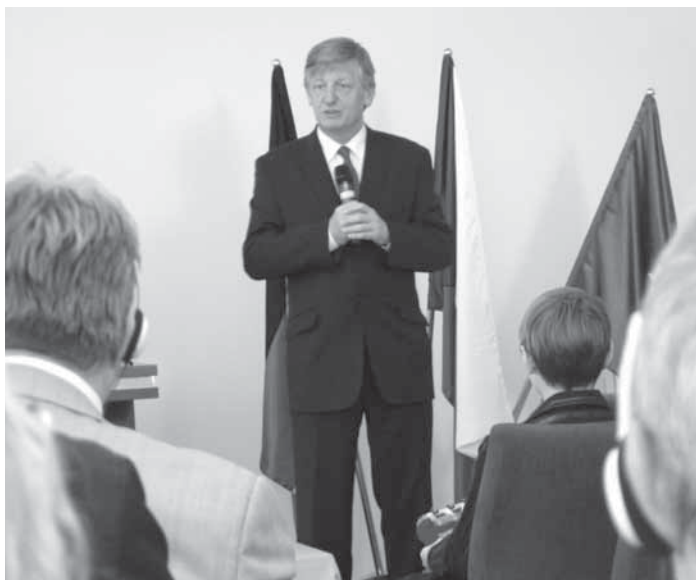
Ministr kultury ČR Václav Riedelbauch.