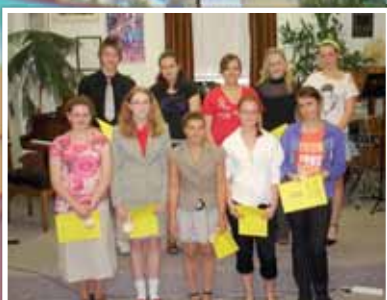
Absolventi ZUŠ předvedli, co se naučili