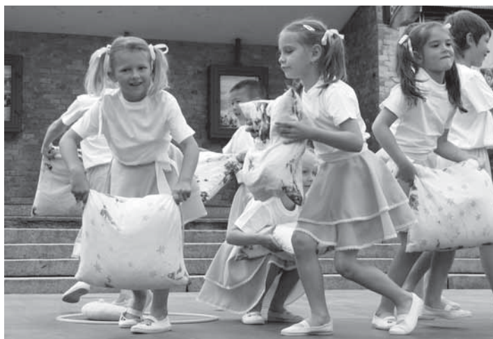
Děti z mateřské školy ve Školní ulici si v rámci 17. ročníku Letních městských slavností připravily taneční vystoupení Sen.