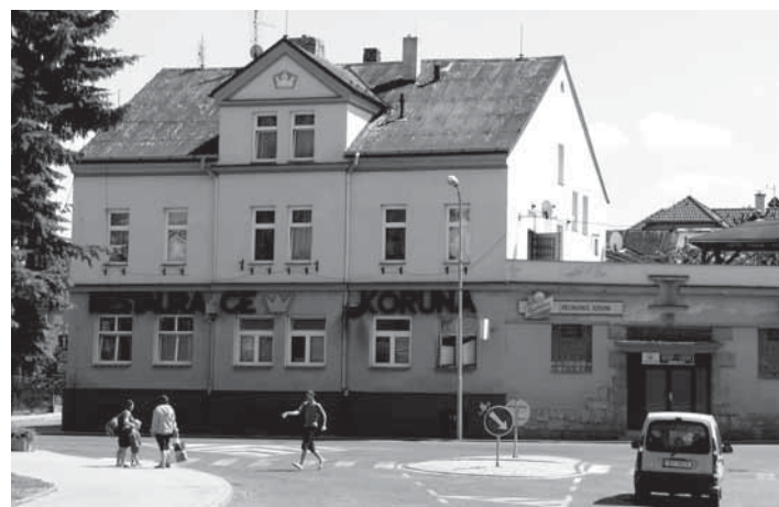
Město Kynšperk nad Ohří chce vrátit obyvatelům zpět taneční sál. Možnost koupě objektu KORUNA ke zřízení kulturně-společenského zařízení přímo vybízí.

„Již několik restaurací ve městě, a to včetně takových objektů jako je hotel Bílá Labuť aj., změnilo v poslední době majitele, přičemž jejich noví provozovatelé mají téměř ve všech případech vůli změnit účel užívání na herny, nonstop bary atd. Máme za to, že nechat dál běžet tento trend, a objekty v centru města pustit k takovému užívání, není vhodné. U restaurace Koruna o to víc, že se nabízí možnost daleko levnější realizace záměru obnovit v našem městě společenský objekt. Koruna původně sloužila jako společenské centrum, je vhodně položena