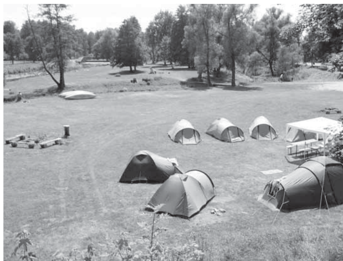
Pod kynšperským mostem je zatím jen několik málo vodáků.