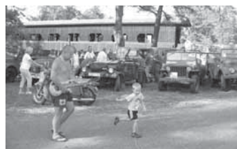
U lávky si děti mohly vyzkoušet, jaké to je sedět ve vojenském terénním vozidle.