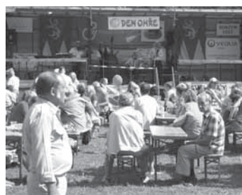
K poslechu hrál návštěvníkům i Pražský pouťový orchestr.