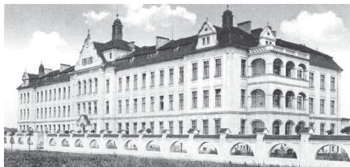
Původní „barokní“ podoba chebské nemocnice z roku 1910.

Výjma rekonstrukce dojde také v příš- tím roce k výraznému doplnění přístro- jové techniky a lůžek v rámci získan- é dotace kraje z fondů Evropské unie - ROP. V současné době chebská ne- mocnice disponuje 293 lůžky a pracuje v ní 392 zaměstnanců včetně 52 lékařů a 221 zdravotních sester. V roce 2009 bylo hospitalizováno 13.235 pacientů a ambulantně bylo ošetřeno 39.574 pa- cientů.