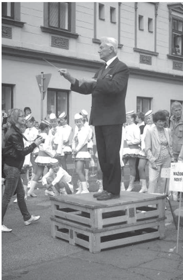
Městská dechová hudba a mažoretky z Kynšperka nad Ohří

Letní dětský tábor – II. ročník netradiční olympiády