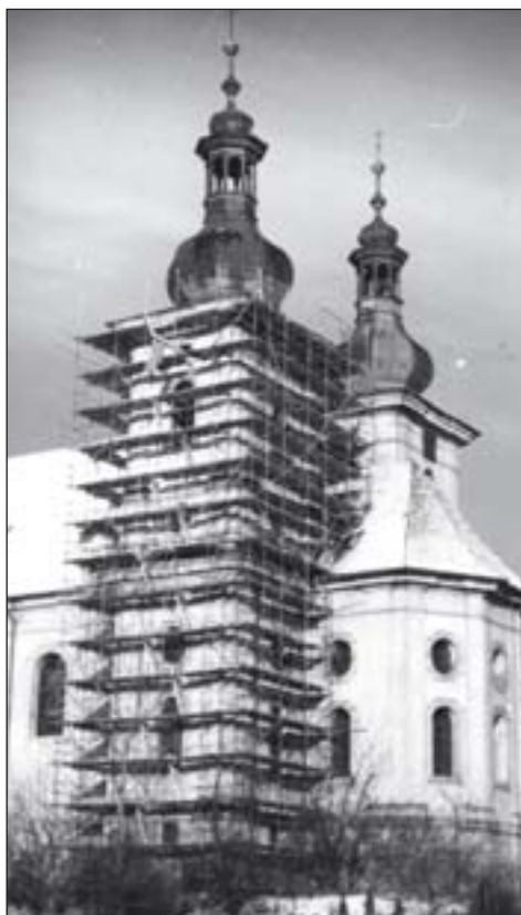
Věž kostela se opravovala před 30 lety