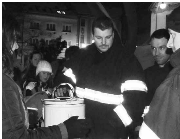
Občerstvení podávali občanům místní dobrovolní hasiči.

Pevné zdraví, klidný, spokojený a pohodový rok 2011.“