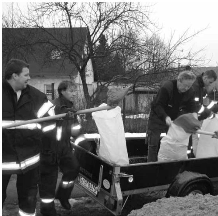
Dobrovolní hasiči z Kynšperka nad Ohří stavějí protipovodňovou hráz za pomoci pytlů, které plnili pískem, v Mostově na Chebsku, kde hrozilo zatopení rodinných domů.