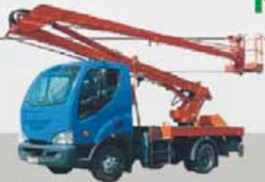
Pronájem plošiny: 590,- Kč / hod. včetně obsluhy