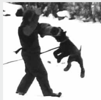
Výcvik - obrana Kerry.