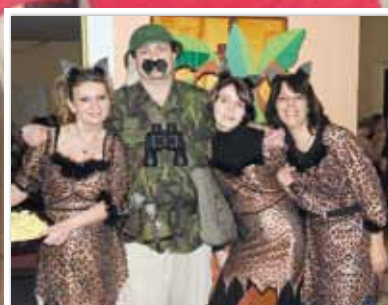
Tématem 11. plesu byla Afrika. Akce se ZUŠ a MKS vydařila strana 11