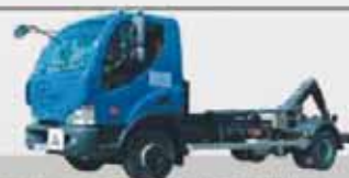
Kontejnery s nosností 5 tun a 7 tun Pronájem kontejneru: 95,- Kč / den Svoz komunálního odpadu pro obce, firmy i soukromé subjekty

»»» Správa majetku Kynšperk n.O. nabízí tyto odborné práce: