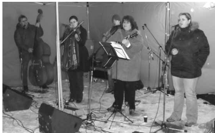
O zábavu se postarala kynšpersko-habartovská kapela Fici.