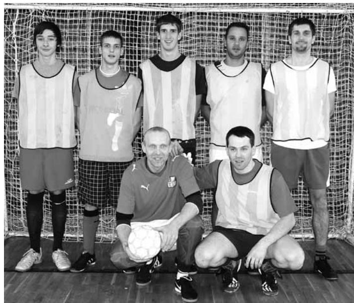
Místní tým Hasiči si vybojoval třetí místo.

16. února 2011 se koná v kulturním středisku od 19.00 hodin jednání Valné hromady TJ Slavoj Kynšperk.