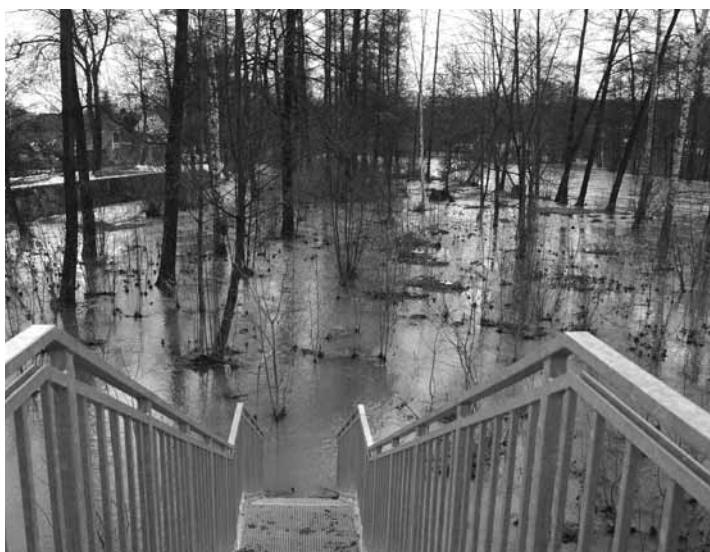
Rozvodněná řeka Ohře v Kynšperku nad Ohří.