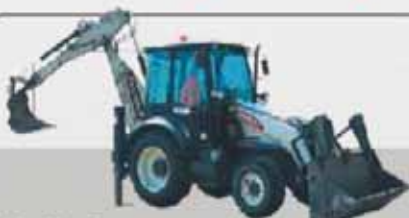
Pronájem Terexu: 170,- Kč / 15 min. včetně obsluhy