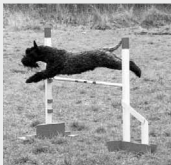
Agility - krásný skok Kerry.

Více fotografií a informací o agility, výcviku a různých akcích naleznete na www.zko-kynšperk.webnode.cz .