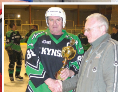
Kynšperští hokejisté porazili protihráče z Li- bavského Údolí strana 11

Florbalový turnaj O pohár hejtmana Karlovarského kraje