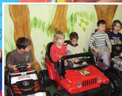
Děti z MŠ U Pivovaru si dopravní hřiště v Sokolově užily strana 4